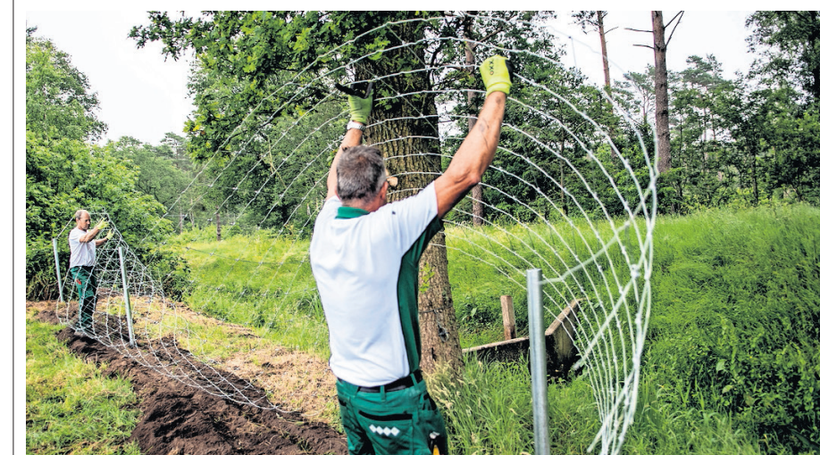
Wolfwerende hekken hebben een hoogte van 120 centimeter en zijn voorzien van stroomdraden.

Bij een collega uit Drenthe waren afgelopen week negen schapen dood, die wel binnen wolfwerende hekken stonden. „Dan klopt er iets niet toch? Er zou een wolvenconsulent met mij contact opnemen. Ik wil horen hoe ik dit zou moeten doen. Het is een enorme investering, dan wil ik wel zekerheid. Maar diegene heeft nog steeds niet gebeld.”