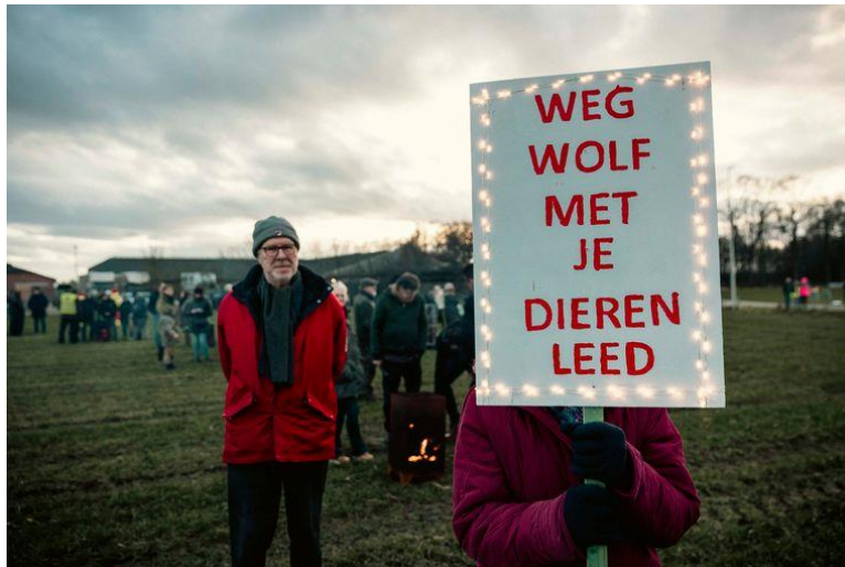
Onlangs werd in het Limburgse Oudsbergen een protestmars georganiseerd tegen de aanwezigheid van de wolf in de streek.